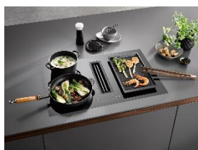
Photo 2 : Récompensé par l'iF Design Award 2023 et le prix Red Dot Design 2023 : grâce à ses deux zones de cuisson reliées par une fonction de pont, le modèle KMDA 7473 Silence permet, par exemple, l'utilisation de la plaque de gril Gourmet.