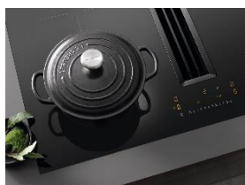
Photo 1 : Le plan de cuisson à induction KMDA 7272 Silence de Miele remporte l'iF Design Award 2023 pour son design à la fois marquant et élégant. Il a également reçu le prix Red Dot Design 2023.